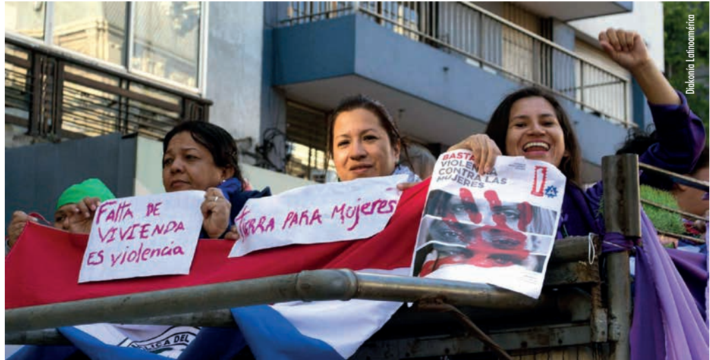
Manifestació de l'EFLAC pel 25N

cuna mapegen les nostres pors i esperances comunes. Algú diu «sóc feminista al barri perquè és al barri que també ens maten», «perquè vull caminar lliure per la nit», «perquè sóc feminista a tot arreu». En grups ens conviden a pensar com seria una ciutat feminista. Com serien els seus carrers? Qui i com gestionaria els serveis? Com seria l'educació? I així seguim somiant alternatives des de diferents mirades, la institucional es troba amb l'anarquista, la indígena amb la lesbiana urbana, la brasilera amb la sueca-peruana. Som un animal col·lectiu que s'ensuma, es reconeix i s'interpel·la. Som diversitat pura interseccionant les nostres realitats i mirades.