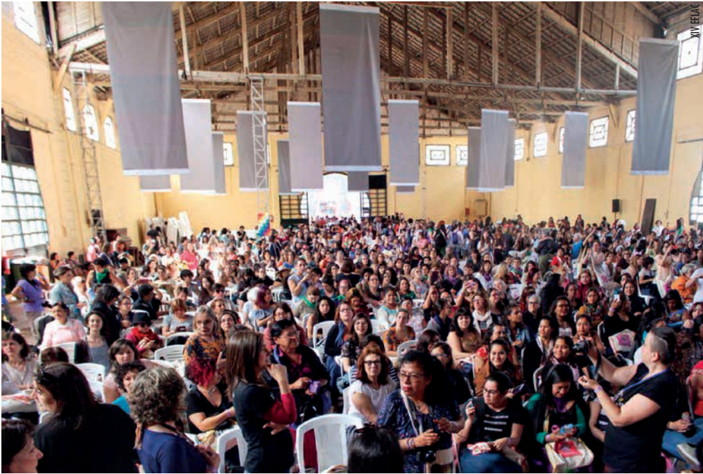
Reunió plenària de l'EFLAC