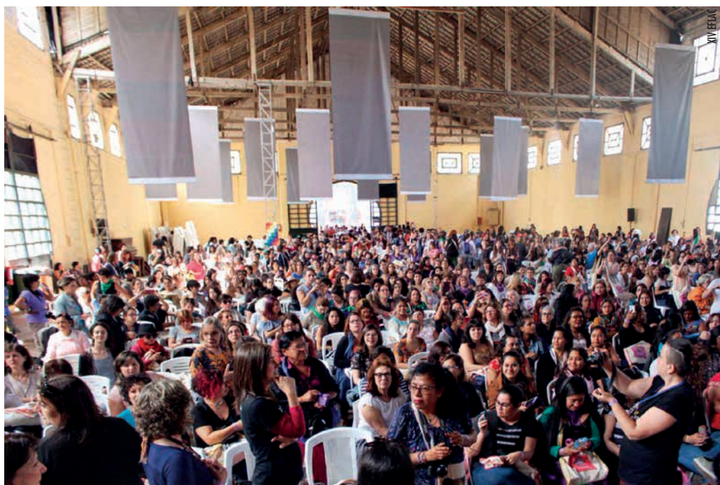
Reunión plenaria da EFLAC