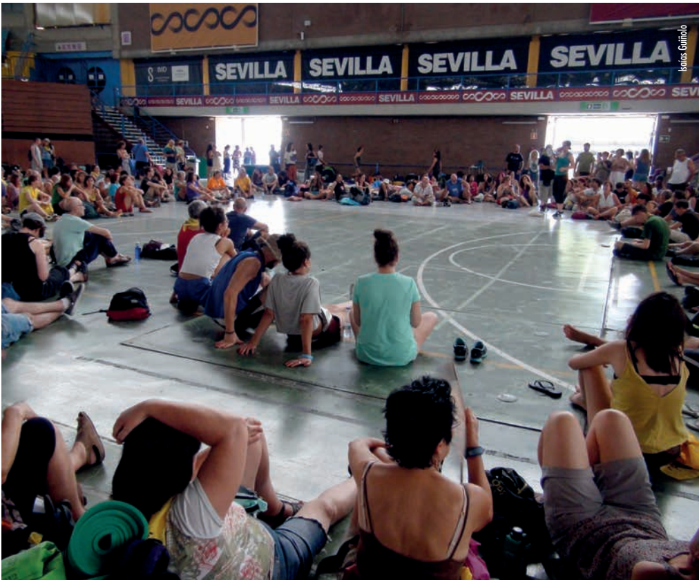
Asemblea da Caravana en Sevilla

gais (devolucións en quente), a omisión de socorro e do Dereito do Mar a persoas que naufragan en augas españolas, e que en moitos casos se acude á xendarmería marroquí, mesmo estando en augas da xurisdición española; o abandono de nenos e nenas en mobilidade (os mal chamados MENAS, menores non acompañados) nas rúas de Melilla, sen aplicarlles os acordos internacionais de interese superior do menor; as condicións dos CIE (Centros de Internamento para Extranxeiros), onde permanecen privados de liberdade e en pésimas condicións, persoas que non cometeron ningún delito; a externalización de fronteiras a terceiros países (Turquía, Marrocos) pagándolles moitísimos millóns para que fagan o papel sucio que os países europeos non queren facer, ou os discursos e argumentos que fomentan o racismo e a xenofobia, o desprezo e o rexeitamento.