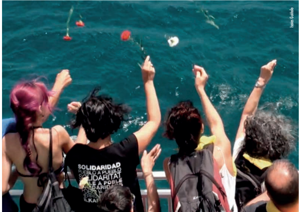
Caraveis en memoria das persoas que perderon a vida no Mediterráneo

trol das persoas migrantes, e sen o sistema perverso de deportación non sería posible. Por iso se traballa por afrontar esta realidade, que ademais se sustenta, como todos os dispositivos de represión, no lucro. Por iso, é que se anima activamente a sumarse ao boicot das compañías que xestionan os macro voos especiais de deportación, que supoñen en torno a 12.000.000€ anuais.