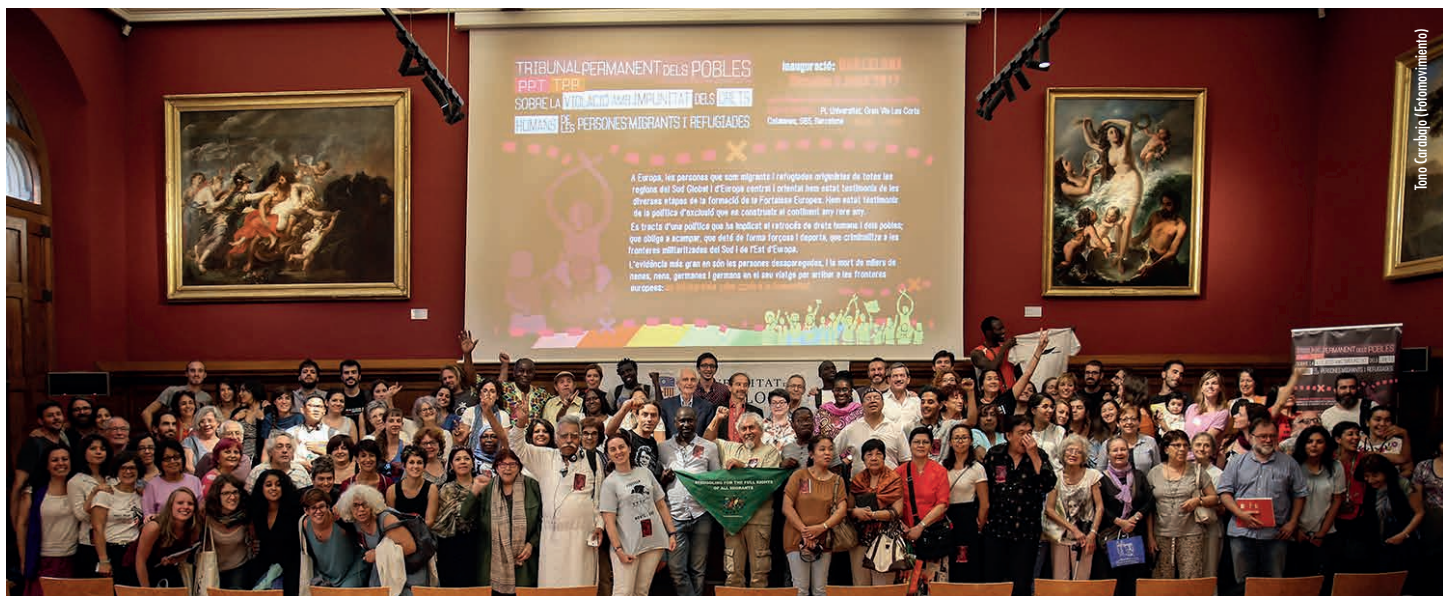
Acte de llançament del TPP a Barcelona

El model capitalista neoliberal s'articula actualment al voltant de la criminalitat i la impunitat. Els directius de les empreses transnacionals més importants del món i de la banca internacional reben tots els honors malgrat del seu paper en les crisis financeres globals i altres desastres que afecten el planeta.