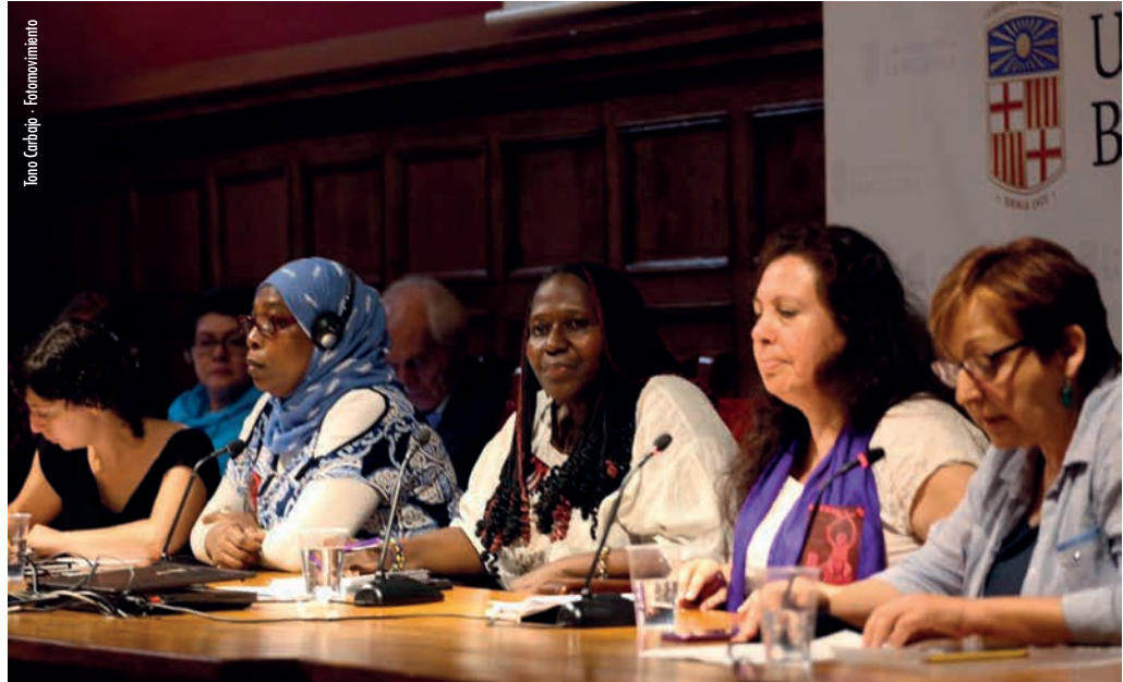
Acte de llançament del TPP a Barcelona

Confiam que aquest procés permetrà donar poder i donar major visibilitat als Pobles Migrants