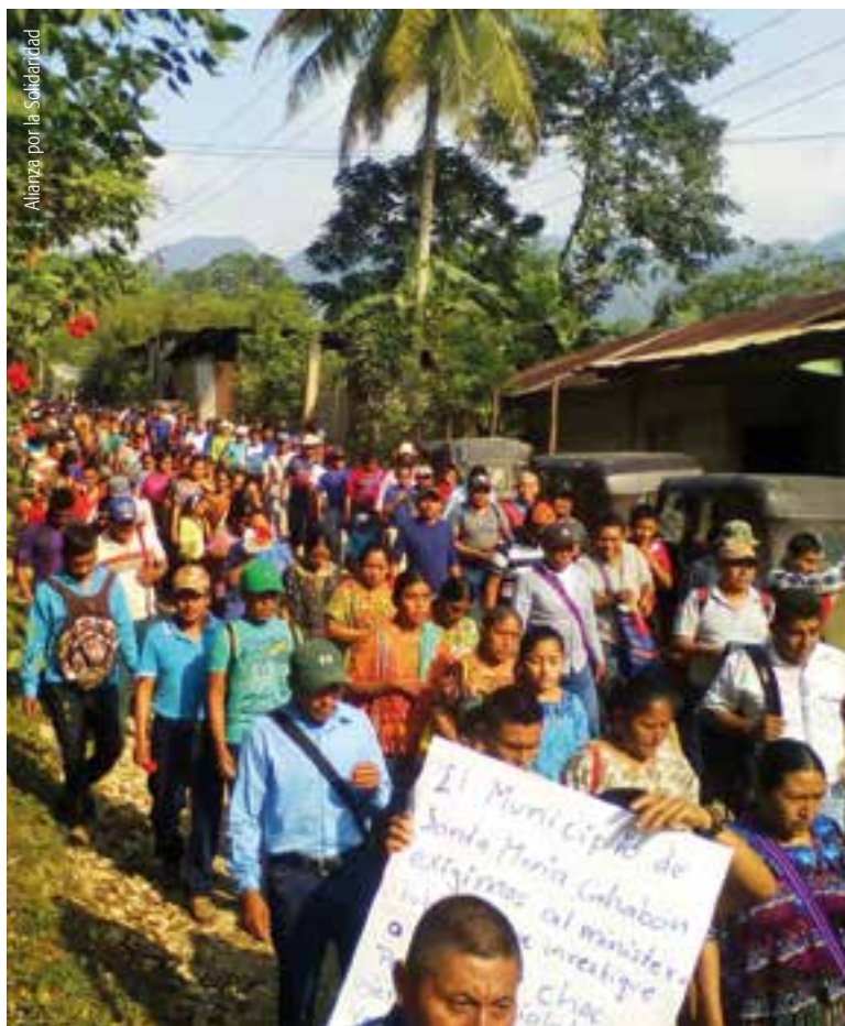
Alianza por la Solidaridad

Aquesta és una de les tantes realitats de cara a la covid-19, que queden fora de les cobertures informatives. Durant més de dos mesos els mitjans de comunicació i les xarxes socials estan saturades amb informació del nombre de contagis, de morts, de l'impacte en l'economia, de l'augment en els índexs de pobresa i de les manques del sistema de salut. És necessari donar cabuda a les veus dels qui s'enfronten a aquest monstre insaciable que ens ven la idea d'un desenvolupament que paguen molt car les majories i la naturalesa, perquè contribueix a evidenciar que aquesta és una crisi global i social, ecològica i econòmica, producte dels impactes ambientals acumulats provocats al planeta. Molt poc s'ha dit de com la destrucció massiva d'ecosistemes, la depredació i el saqueig de béns naturals redueix els espais per a la vida silvestre i exposa als éssers humans a noves formes de contacte amb microbis; de com la industrialització de la producció d'aliments animals és la principal font de contagi en provocar mutacions dels virus que afecten l'espècie humana.