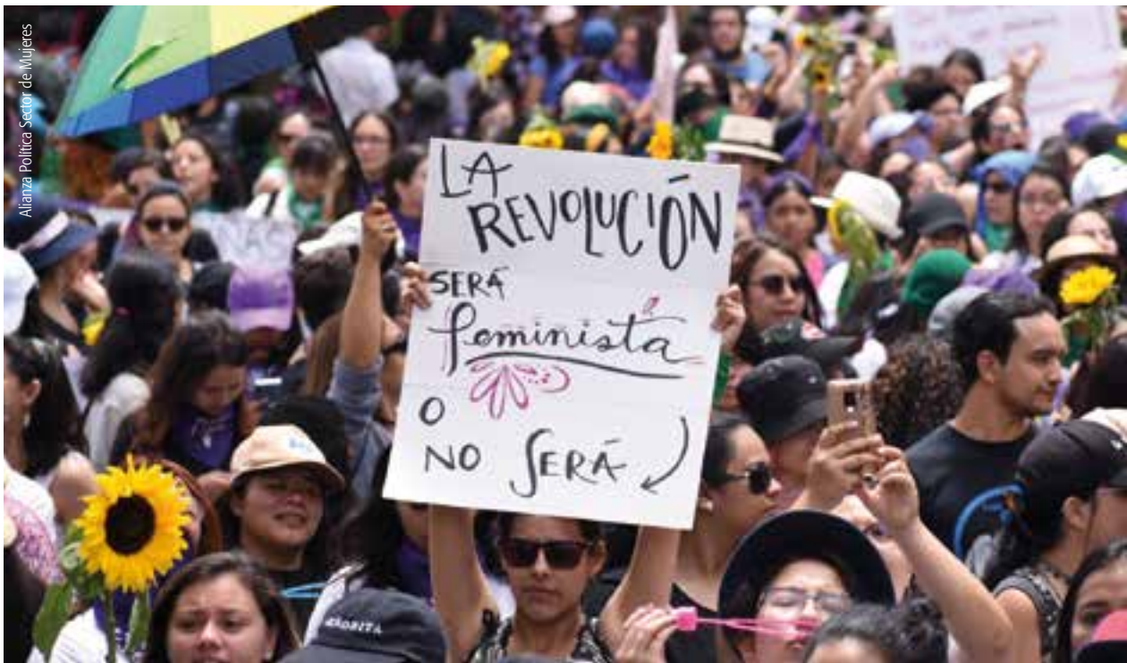
Alianza Política Sector de Mujeres

política i ambiental que enforteixen esferes d'economies alternatives i autogestió. Estendre i aprofundir aquestes experiències és una alternativa per enfrontar la crisi que deixa el coronavirus. amb economies desenvolupades des dels territoris, que poden contribuir a una democratització des de baix, modificant pràctiques de consum per desenvolupar una nova relació amb la natura.