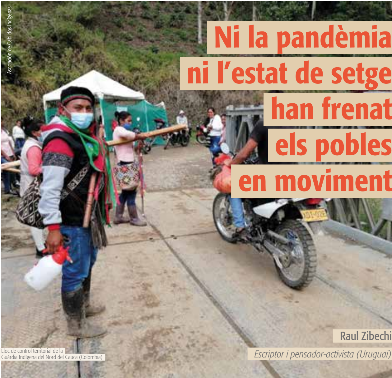
Lloc de control territorial de la Guàrdia Indígena del Nord del Cauca (Colòmbia)