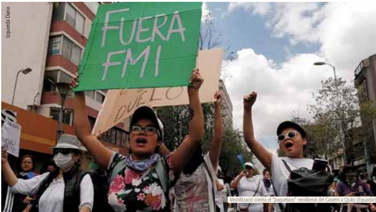
Mobilització contra el "paquetazo" neoliberal del Govern a Quito (Equador)

països llatinoamericans són constantment empesos a perpetuar el seu caràcter d'economies exportadores de matèries primeres, sempre vulnerables i dependents. Violències, corrupció i autoritarisme, en governs neoliberals i "progressistes" –no confondre amb d'esquerres– assetgen la democràcia. Tanta brutalitat no és una simple conseqüència dels extractivismes, sinó una condició necessària per a la seva cristallització. I tot emmarcat en accions pròpies dels imperialismes, als quals poques vegades s'incorpora en les anàlisis.