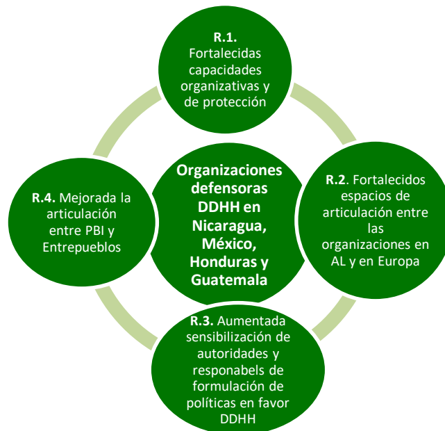
Gráfico 1. Objetivo específico y resultados del Programa

El Programa se diseñó para que las organizaciones indígenas y campesinas, y organizaciones de mujeres de México, Honduras, Nicaragua y Guatemala se fortalecieran en su trabajo de protección y defensa del derecho al territorio, a la participación, a una vida libre de violencia, a los derechos sexuales y reproductivos, así como también para que ampliaran su espacio de actuación en contextos de criminalización a defensores y defensoras de derechos humanos (objetivo específico). Para tales fines, se elaboró una estrategia de trabajo que pretendía contribuir al logro de cuatro resultados (ver Gráfico 1). A continuación se analiza el logro de cada uno de estos resultados, en base a la documentación revisada y a las personas y organizaciones consultadas durante esta evaluación.