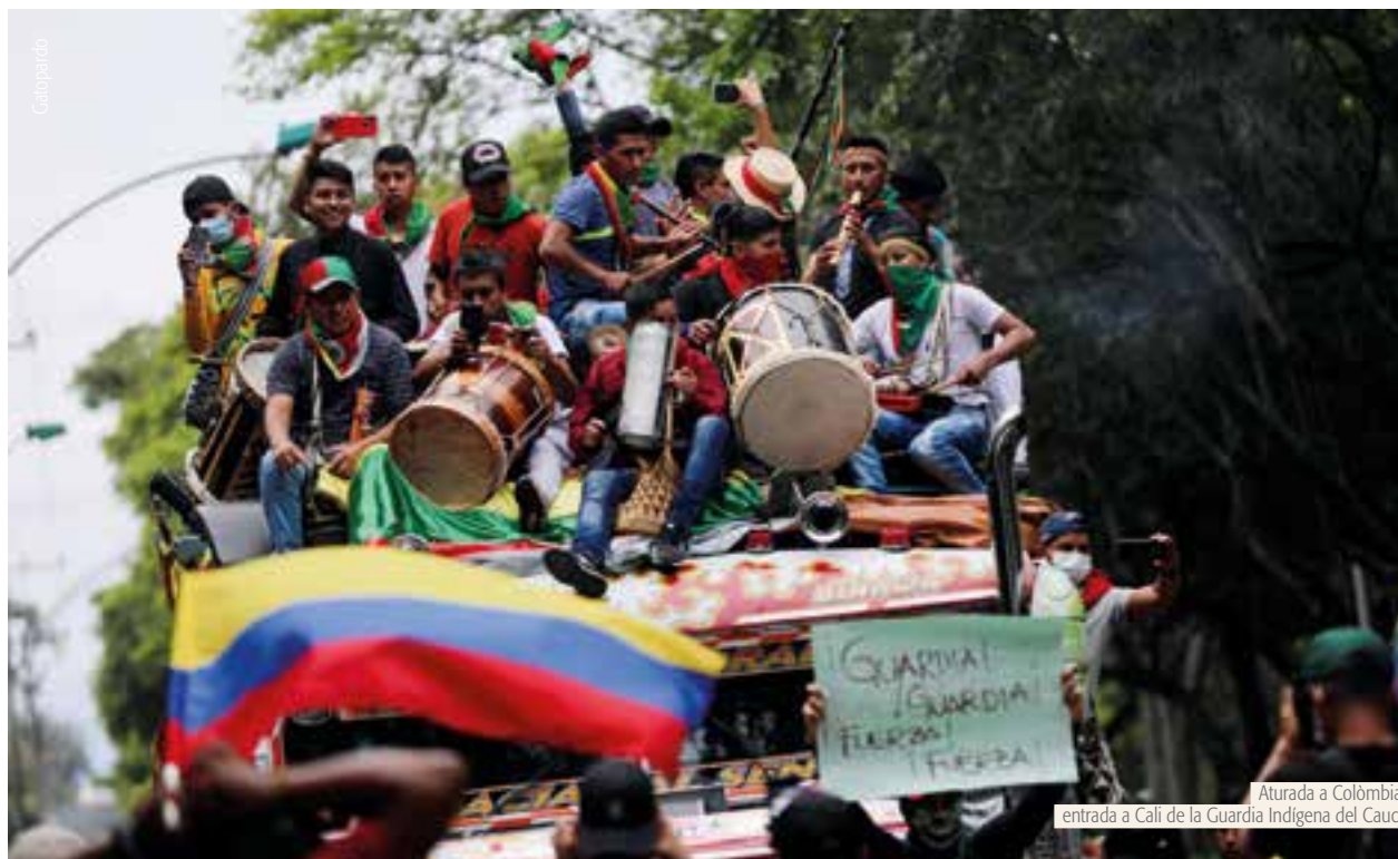
Aturada a Colòmbia: entrada a Cali de la Guardia Indígena del Cauca