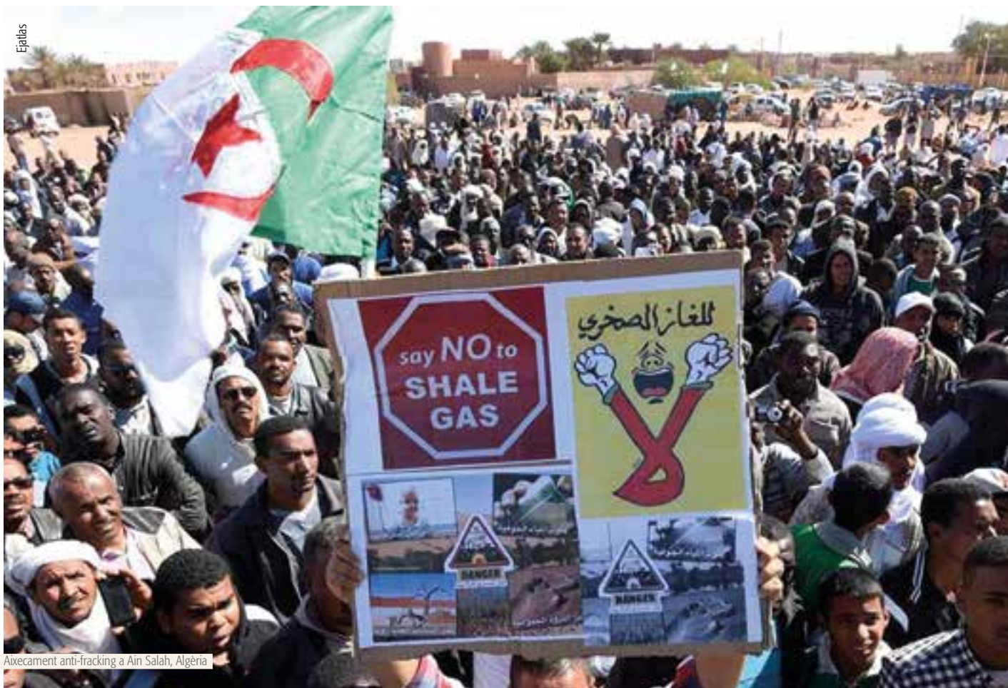
Aixecament anti-fracking a Ain Salah, Algèria

nible i destructiu. Aquest model es basa en l'exportació de cultius comercials i l'esgotament de terra i dels escassos recursos hídrics de regions àrides i semiàrides com Egipte i el Marroc.