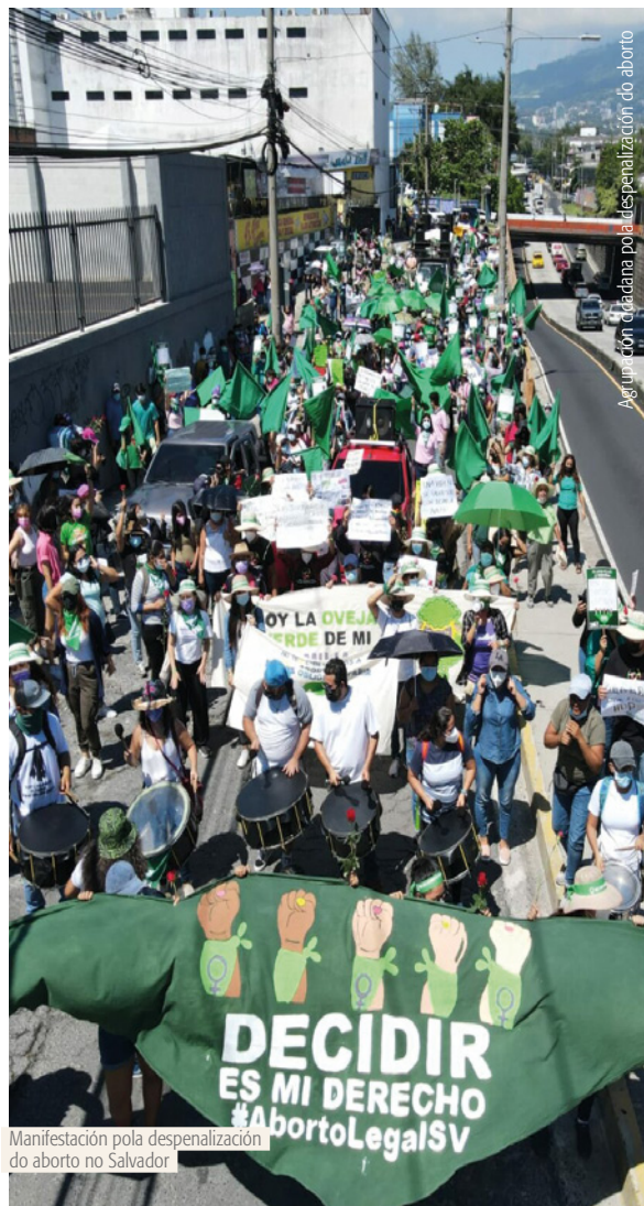
Manifestación pola despenalización do aborto no Salvador

Ademais, 452.000 persoas non teñen acceso á educación ou traballo (que se agrava no caso das mulleres). “O 70% da xuventude considera que migrar é a mellor solución. Coa pandemia e co réxime de excepción, estase investindo máis en militares ou en abrir cárceres que en crear escolas ou mellorar o sistema educativo salvadoreño”, conclúe.