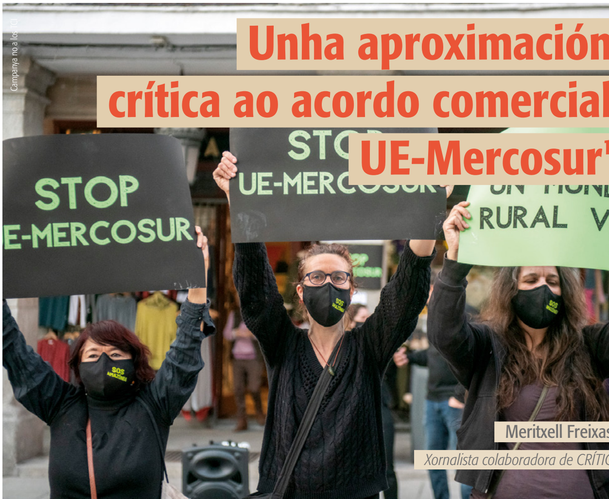
Campanya no a los TCI