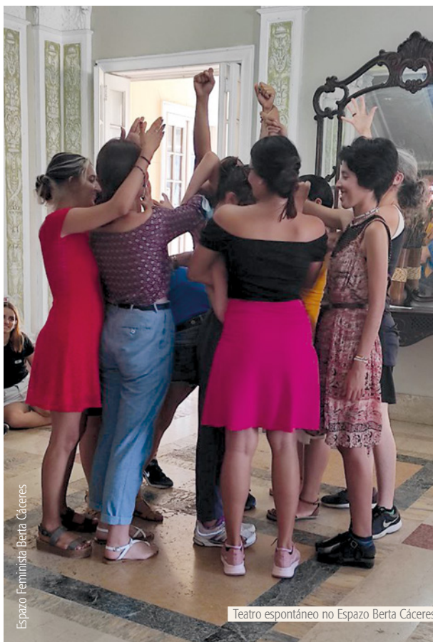
Espazo Feminista Berta Cáceres