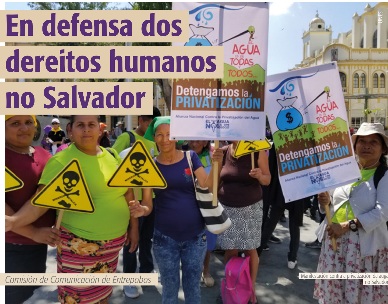
Comisión de Comunicación de Entrepobos