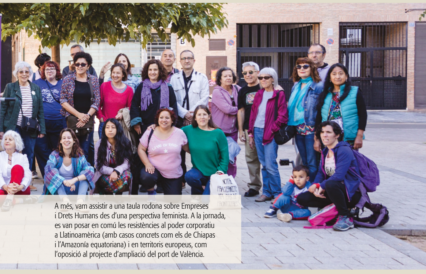
A més, vam assistir a una taula rodona sobre Empreses i Drets Humans des d'una perspectiva feminista. A la jornada, es van posar en comú les resistències al poder corporatiu a Llatinoamèrica (amb casos concrets com els de Chiapas i l'Amazonia equatoriana) i en territoris europeus, com l'oposició al projecte d'ampliació del port de València.