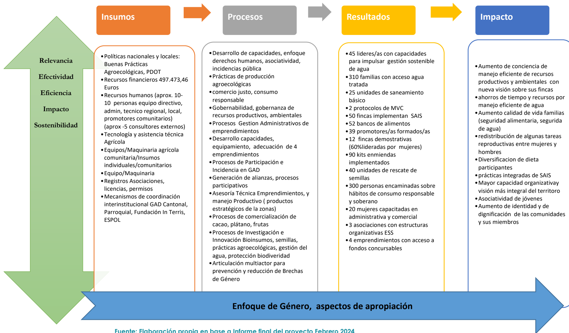
Figura 3.1. Marco lógico / Teoría de Cambio del Proyecto